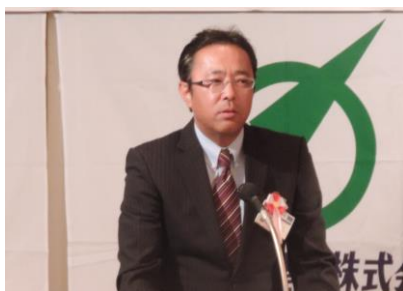
安全表彰受賞者（企業の部）