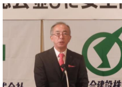
出席者全員で安全を誓った