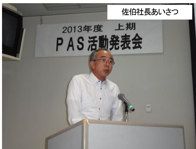
佐伯社長あいさつ