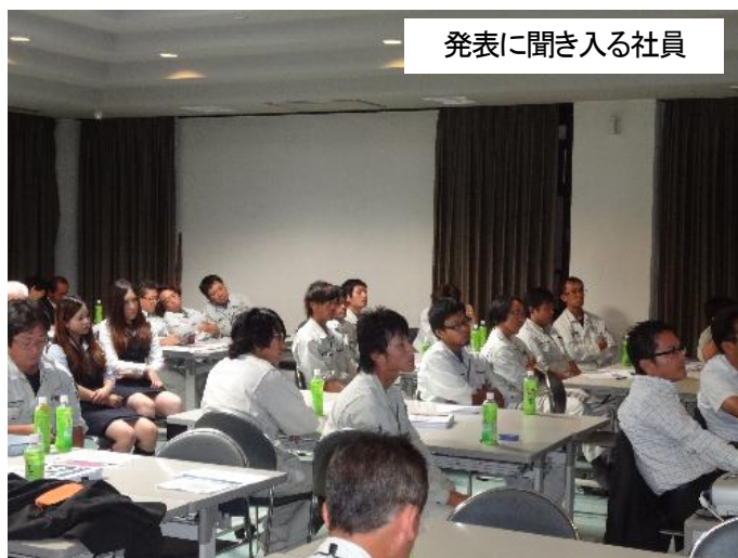
発表に聞き入る社員