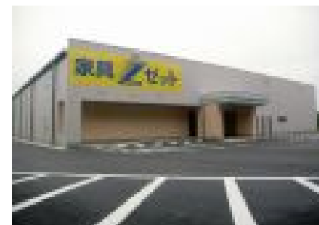
【マルヤス家具多治見店 新築】 (担当)：後藤賢二・渡辺真司