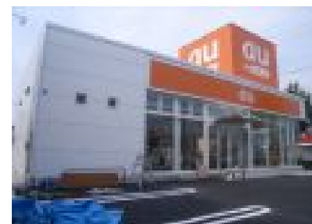
【auショップ岐南店新築工事】 (担当)：大池 哲弘