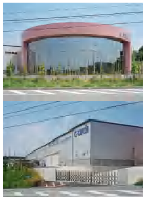
【後藤工業株式会社新築】 写真：事務所・工場 (担当)：長谷川勝