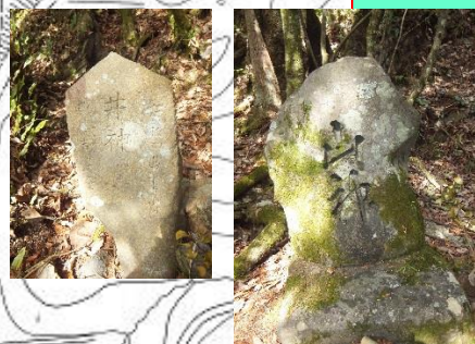
秋葉神社下の谷川に井神と山神