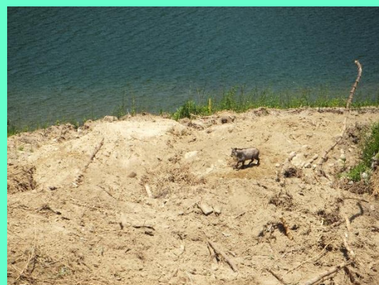
2013春に見かけた日本カモシカ