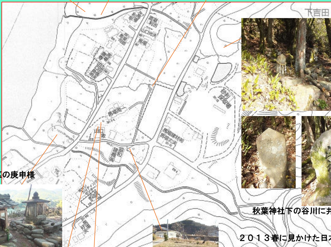
大落地区の庚申様