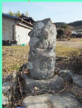
落の馬場家周辺の不動明王と氏神