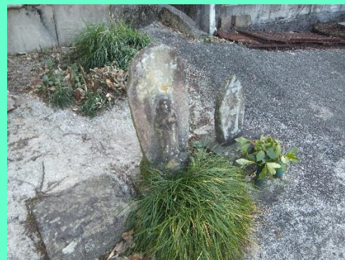
小高い道端の地蔵様と観音様